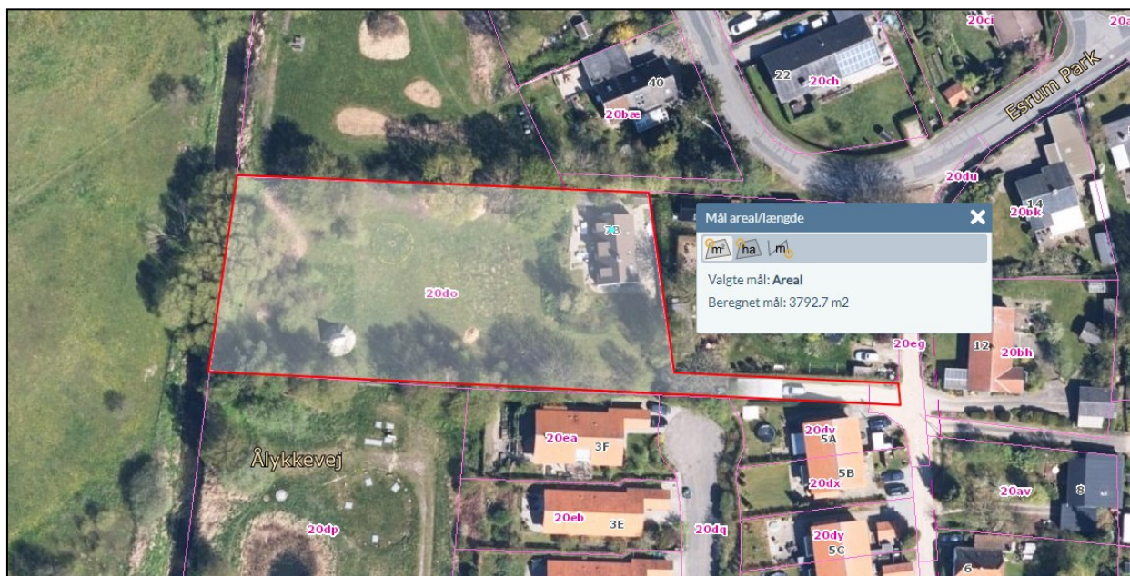
Figur 1: Luftfoto 2023 med markering af ejendommen Ålykkevej 7B, matr. 20do.

Matriklen grænser mod nord op til fællesarealer tilhørende hhv. Grundejerforeningen Esrum Park (matr. 20a), Klosterparken (matr. 20bm) og Rishavepark (matr. 20bl). Tidligere har der været et renseanlæg på matr. 20a (Esrum renseanlæg), men denne blev nedlagt på et tidspunkt i perioden 1999-2002. Grunden har siden 1974 været ejet af Grundejerforening Esrum Park. Renseanlægget har formodentligt været forsvarligt hegnet, men det kan ikke udelukkes at det har været muligt at passere renseanlægget langs Esrum Å. Med renseanlæggets nedlæggelse, blev der anlagt en underjordisk pumpestation til spildevand på matriklen mod syd (matr. 20dp). Anlægget kan ses på luftfoto, jf. bilag 2. Kommunen købte "gartnergrunden" i 1995. Der blev i 2011 anlagt et regnvandsbassin, og området fremstår i dag som et offentligt tilgængeligt rekreativt areal ejet af Gribskov Forsyning, som overtog grunden fra kommunen i 2010.