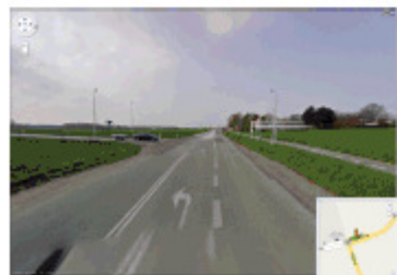
Tisvildevej - Kildevej, Vejby