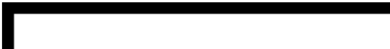
Tabel 1: Affaldsmængder fordelt på erhvervs-kilder fra 2008 til 2024

Affaldsmængderne vil for husholdninger stige fra 490.000 tons i 2009 til 599.000 ton i 2024, jf. Tabel 1. Samtidig vil erhvervsaffaldsmængderne stige fra 423.000 ton til 497.000 ton, jf. Tabel 1. Affald fra byggeri og anlægsvirksomhed vil stige fra 569.000 ton til 632.000 ton, jf. Tabel 1. Affald fra renseanlæg fremskrives ikke i denne prognose, og mængderne er således uændrede fra basisåret og frem.