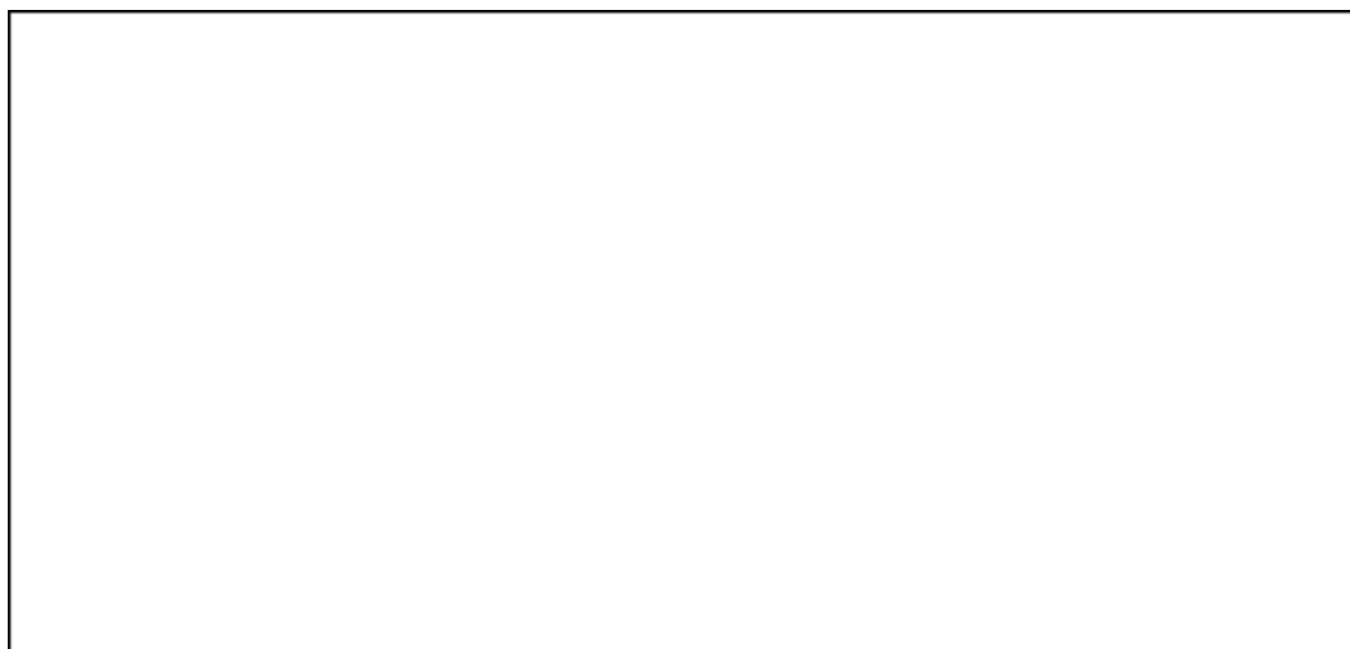
Figur 2: Affaldsmængder fordelt på erhvervs-kilder fra 2008 til 2024

Der er benyttet de samme fremskrivningsrater på affaldsmængderne i alle 18 kommuner. Således vil væksten i affaldsmængderne i procent pr. år være den samme i den enkelte kommune som i hele Vestforbrændings opland. Dette gælder alle affaldstyper, fraktioner og kilder.