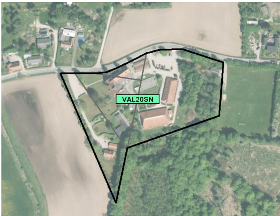
Nyt kloakopland VAL20SN. Oplandet er defineret som matriklerne 18h Valby By, Valby, 1e Valby Hegn, Valby, 18g Valby By, Valby og 18f Valby by, Valby.

Oplandet er afgrænset som vist på figur 1