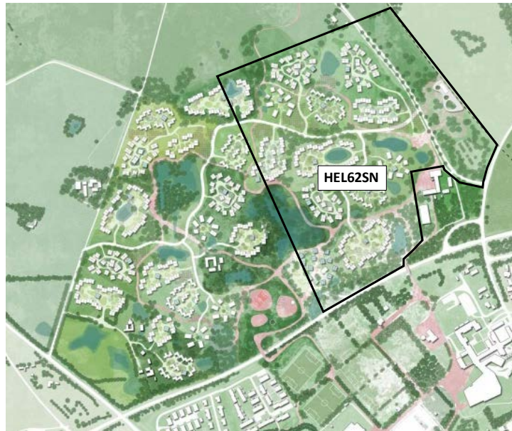
Figur 1. Afgrænsning af kloakopland HEL62SN, Troldebakkerne.

Oplandet bliver på sigt bebygget med ca. 12 klynger som er indbyrdes forbundet med veje. Klyngerne er bebygget med 20-40 boliger og der etableres i alt ca. 350 boliger.